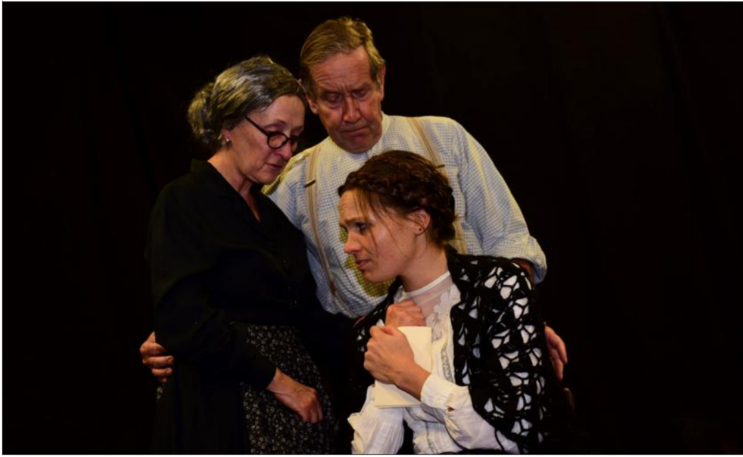
« Frères soldats » plonge le spectateur au cœur d'une famille alsacienne durant la grande guerre.

La pièce, Louis Perrin la situe au cœur d'une famille. « Quand il s'agissait de raconter l'histoire qui se passe en Alsace, j'ai dû imaginer une famille alsacienne, la famille Maurer. Puis j'ai imaginé un person-