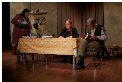
Cela fait quelques années que la Compagnie du Lys n'avait pas joué de drame de ce type.